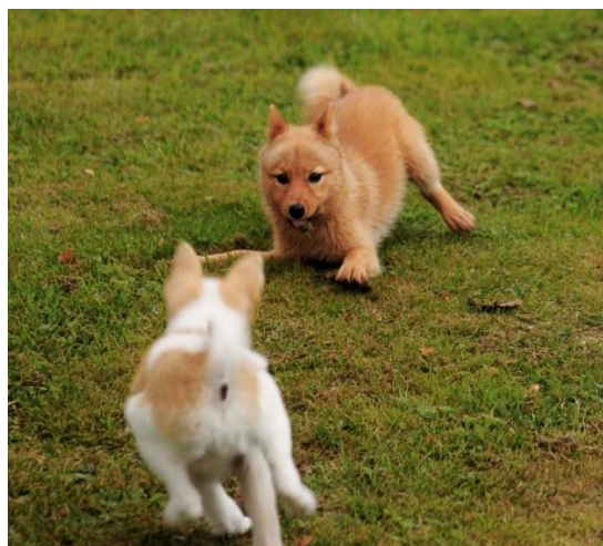
Valplekis – "finnkampen"