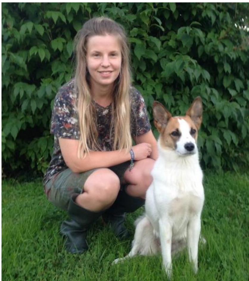
Segrarekipaget Lögdö vildmark, 17/8