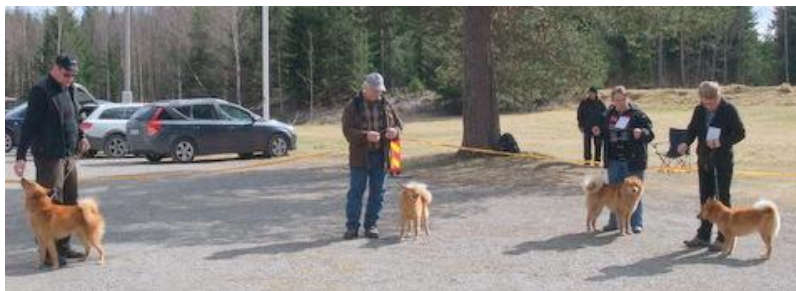
Fyra representanter för Taigans kennel.