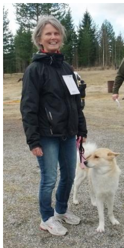
Bratthögens Nilas och matte...