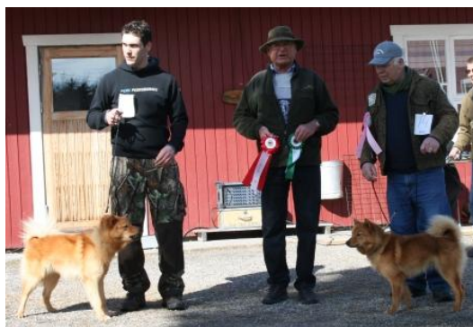
Zakko och Furubolets Mirva - BIR och BIM...