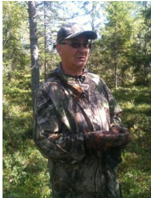
Matti räknar skall...