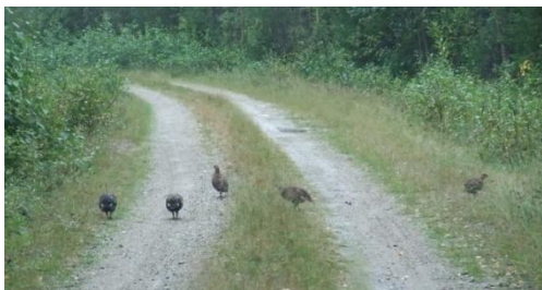
Förnygring vid klubbresan...