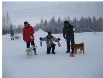
Här får BIS-Valp och BIS2-Valp motta sina rosetter i Gudmundsbyn.