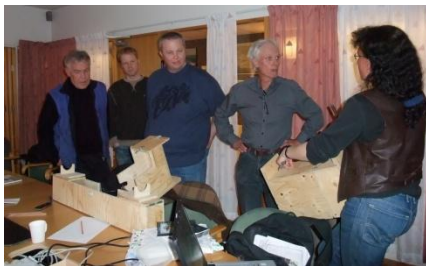
Kurs i fällfångst...