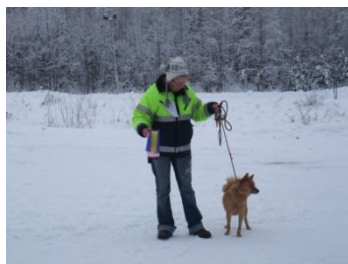
Cert till Chili i Gudmundsbyn...