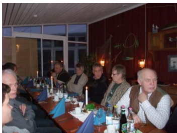
Jaktsnack efter årsmötet...