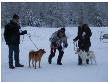
BIS & BIS2 i Gudmundsbyn...