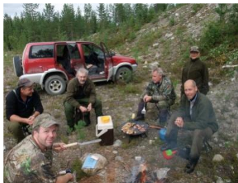
Lunch under klubbresan...