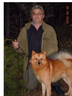
Glad husse efter 1:an...