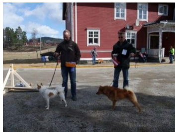
BIS & BIS2 i Stöde...