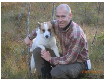
Glad husse efter 1:an...