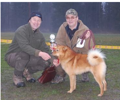
BIS Fort Hjort Jeppe