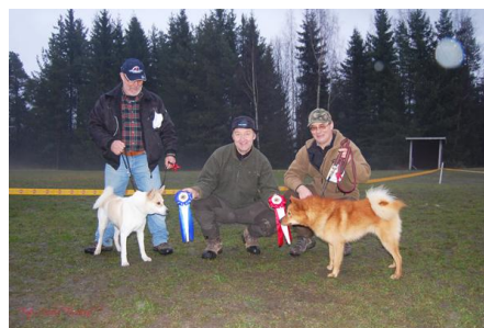
Fort Hjort Jeppe segrade och erövrade därmed BIS.