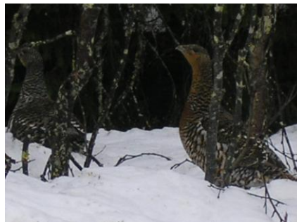
Höns vid spelplats