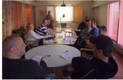
Kurs i lockjakt på räv