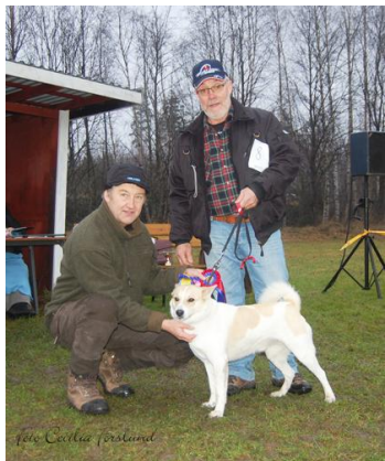
Här mottar Tålsmarks Zack, CK, Cert och BIR av domaren.