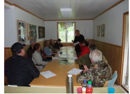
"Hur går ett jaktprov till?"